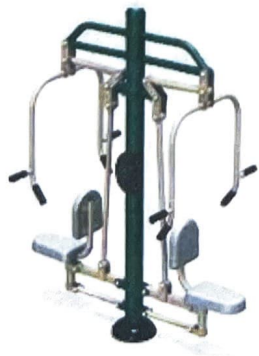
11. Chest Presser