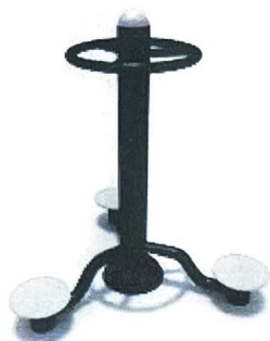
13. Triple Standing Twister