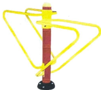
15. Double Bar