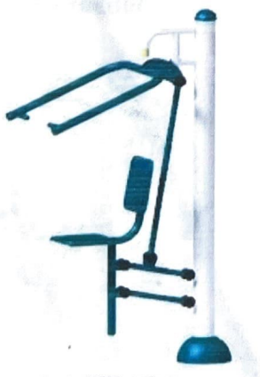
5. Seated Puller