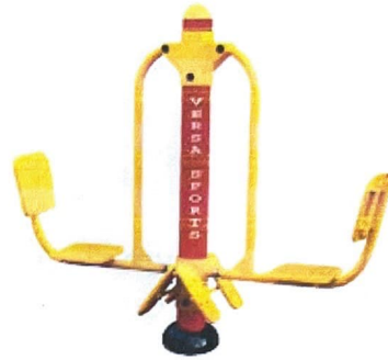
2. Leg Press