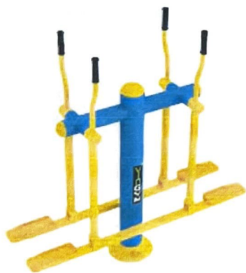
9. Cross Trainer