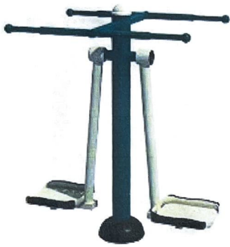
1. Surf Board