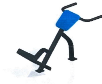
10. Back Extension