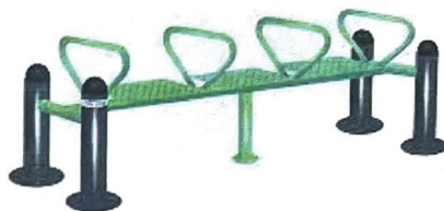
8. Pommel Horse