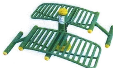
14. Seat up Board