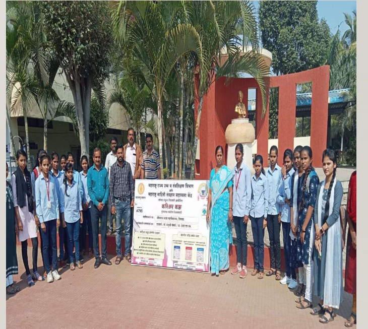
करीअर कट्टा या उपक्रमाच्या पोस्टरचे उद्घाटन