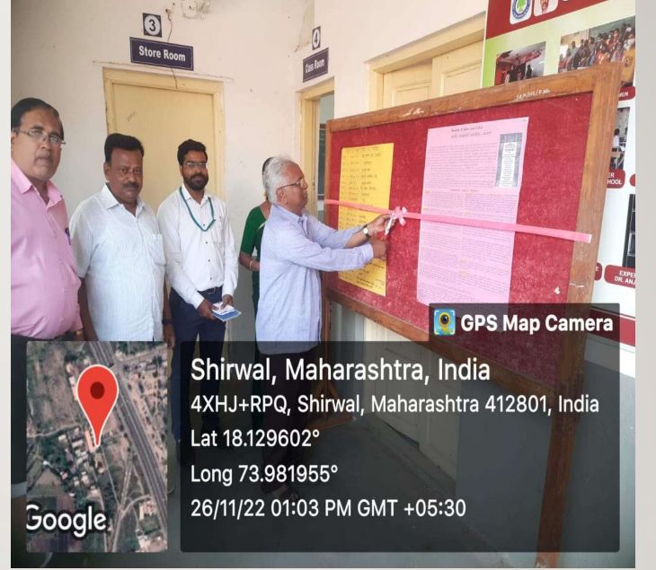
संविधान दिनानिमित्त पोस्टर प्रदर्शनाचे उद्घाटन