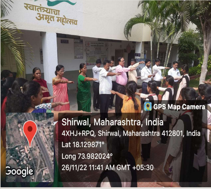
संविधान दिन : उद्देशीकेचे सामुहिक वाचन